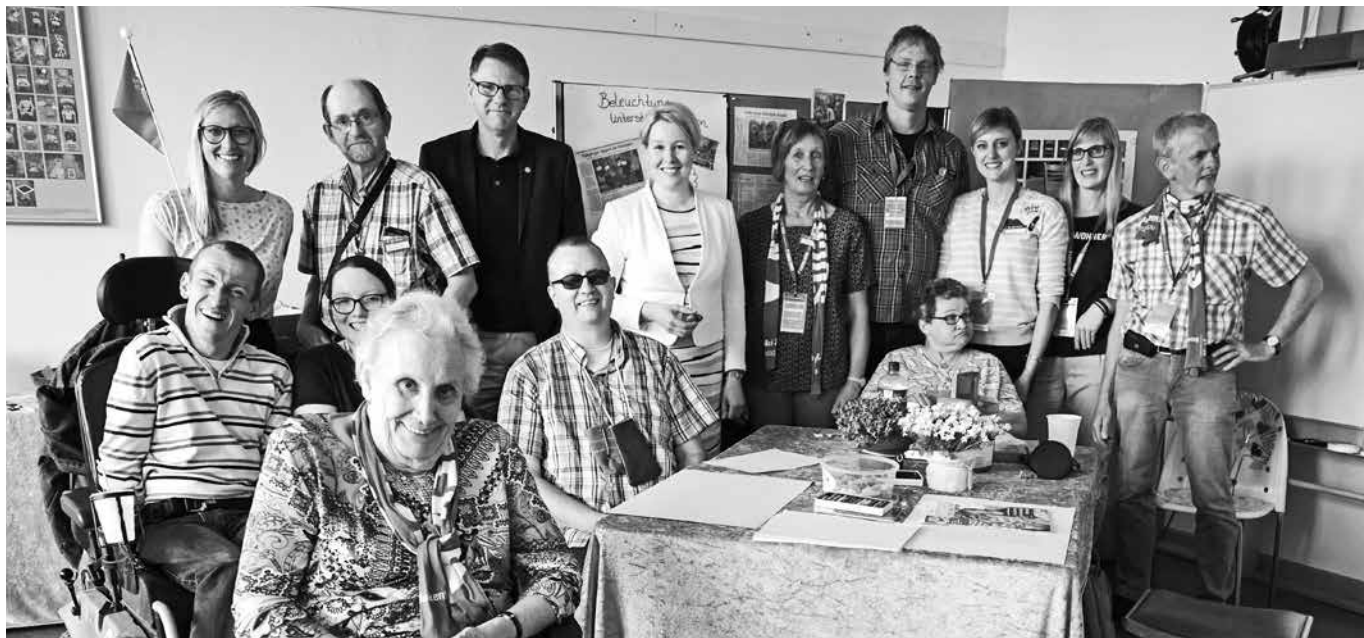
Bundesfamilienministerin Franziska Giffey (hintere Reihe, 4. v. li.) informierte sich anlässlich des Katholikentags in Münster ausführlich über die Lokalen Teilhabekreise in Nordrhein-Westfalen.